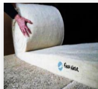
Stocker au sec

Ces informations sont données à titre indicatif, ces produits n'étant soumis à aucune norme actuellement.