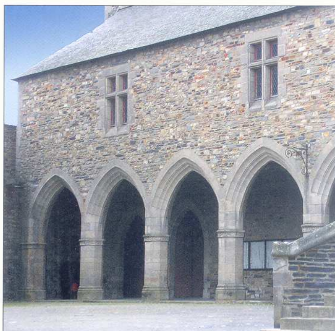
Château de Vitré