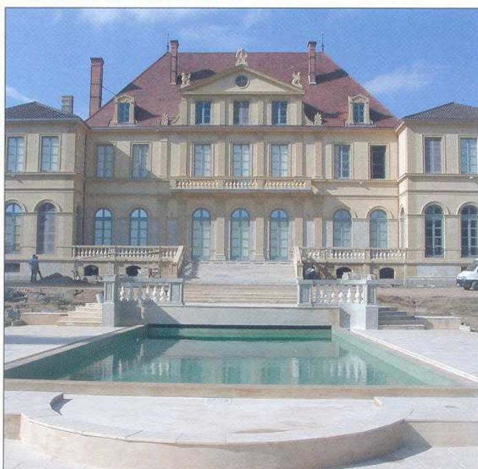
Château de Briennon